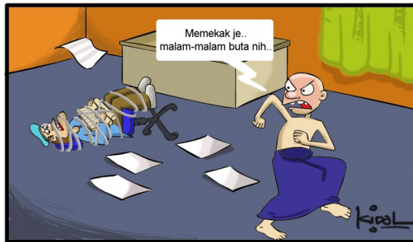
Karya :‘Sarip Puisi’