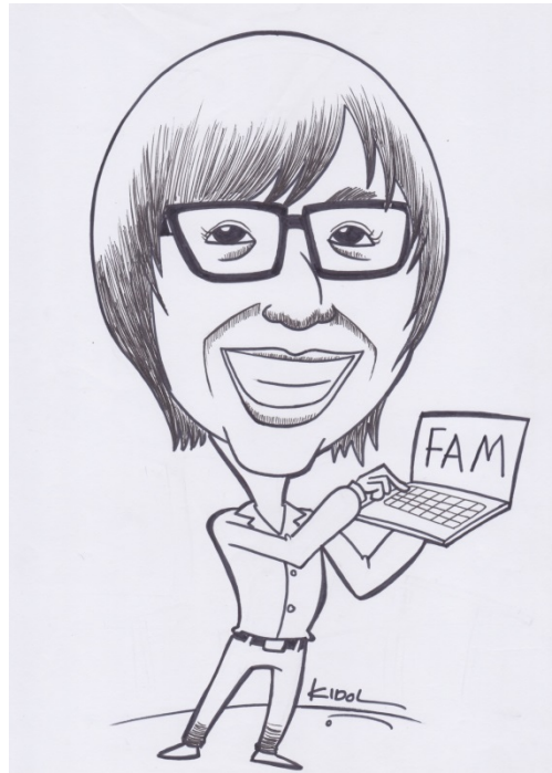
Karya : Karikatur